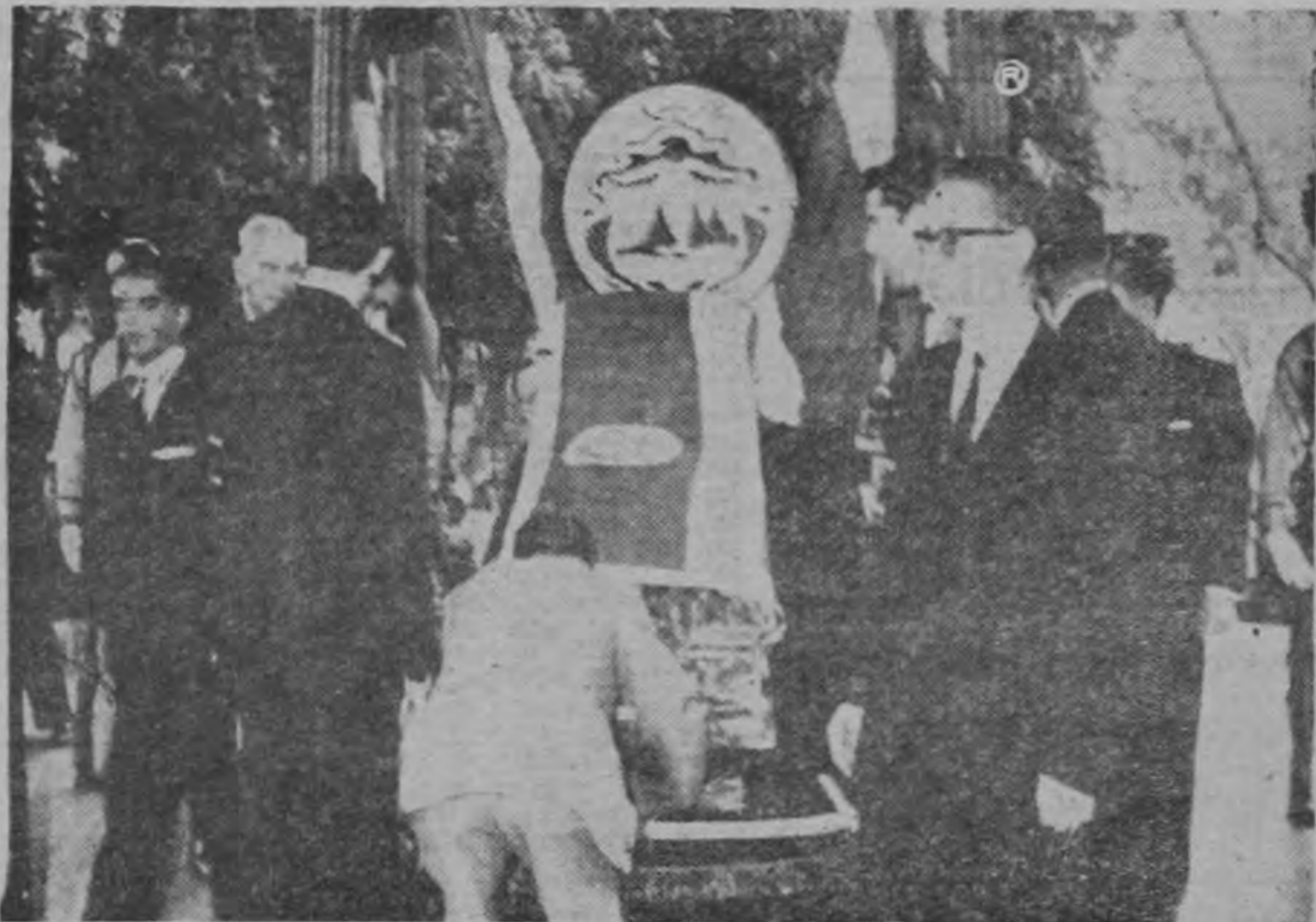
Momento en que se depositaba la caja en el catafalco instalado en el centro del Templo de la Música. Cuatro candelabros y Guardia de Honor permanecerán hasta hoy, en que se procederá a la ceremonia de sepultura al pie del Monumento construido a su memoria.