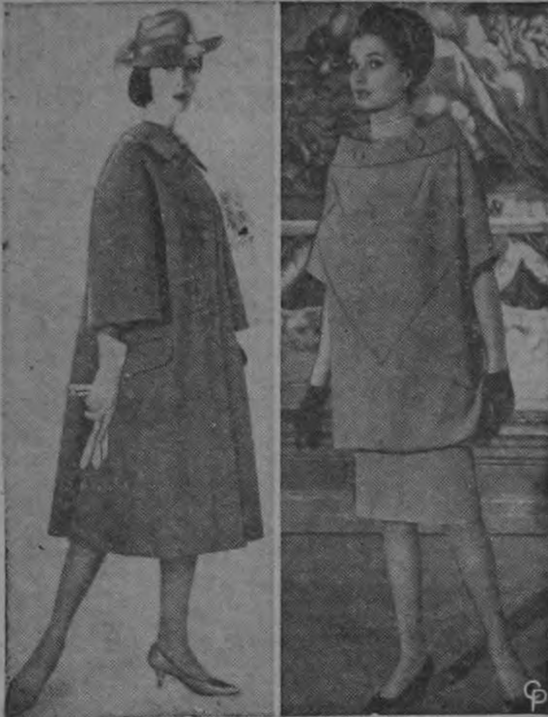
DISEÑO ITALIANO — El modelo de abrigo diseñado por Simonetta de Italia, da realce a las líneas sueltas y a unos hombros curvos desde el cual se desprende unas mangas de tres cuartos. El abrigo está confeccionado en lana. A la derecha aparece una batola diseñada por Marucelli de Roma, con una falda de línea recta y ceñida al cuerpo que llega hasta las rodillas. La batola tiene un cuello redondo y se abrocha en los lados.