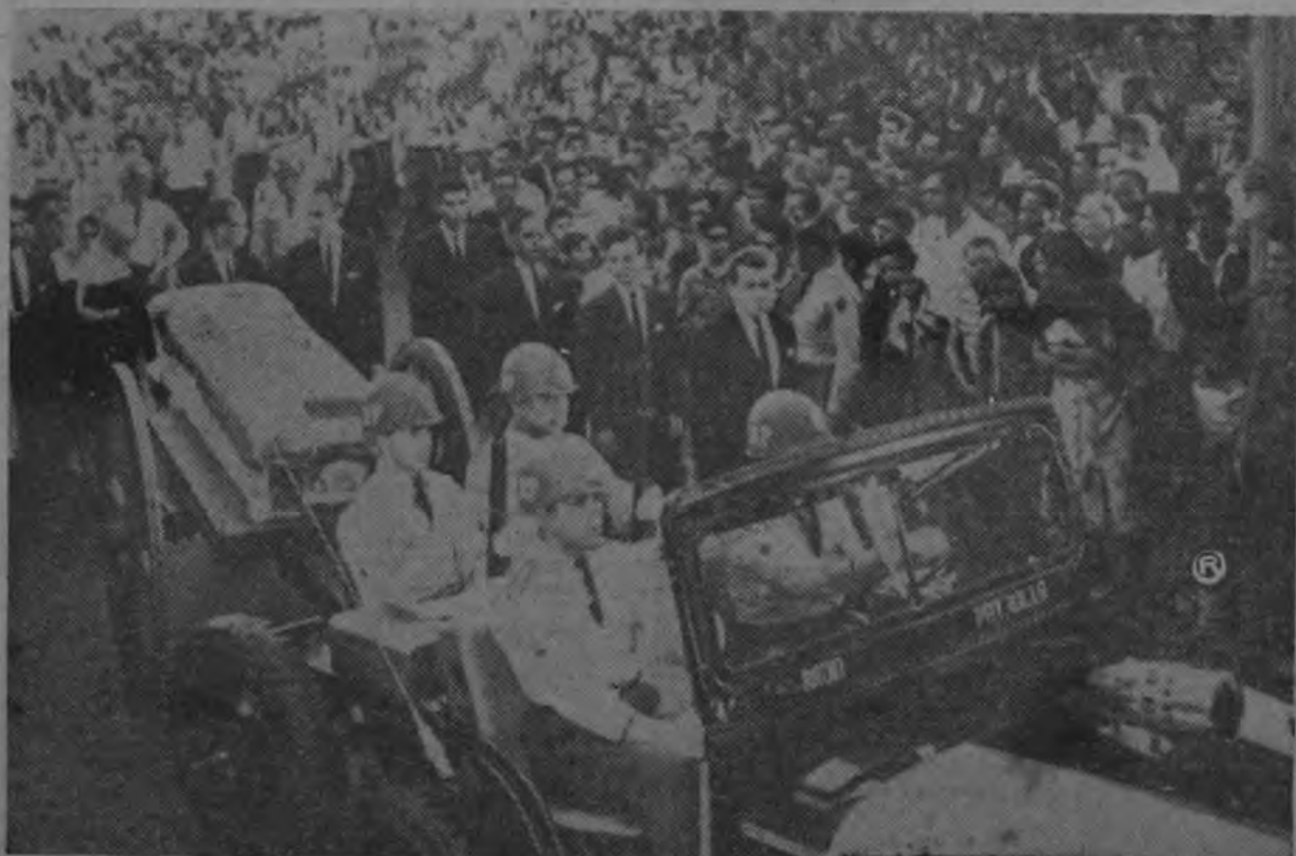
Vehículo de la Radio Patrulla arrastra la cofina en que era conducida la caja mortuoria portadora de los restos de los costarricenses, traídos el lunes desde Coto y depositados en la Funeraria Polini. Rodean el cortejo elementos del Movimiento Nacionalista de Costa Rica que inició y llevó a feliz realización este homenaje. La fuerza militar uniformada de gala presentó los honores militares a que eran acreedores. Centenares de costarricenses que hicieron acto de presencia. EN PAGINA 12)