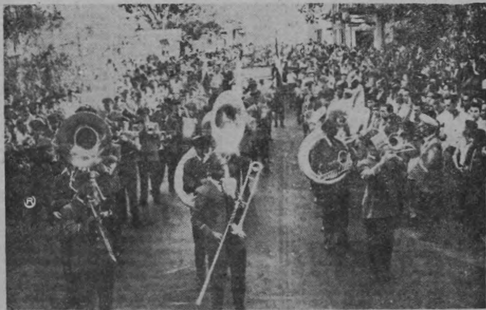
La Banda Militar participó en este homenaje póstumo ejecutando el Duelo de la Patria.